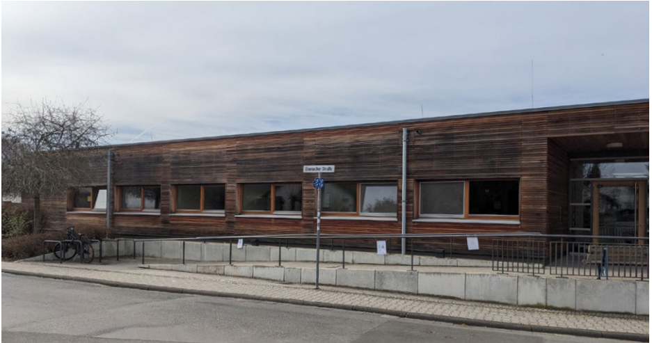
Ansicht von Eisenacher Straße

📍 Eisenacher Straße 11 in 64823 Groß-Umstadt